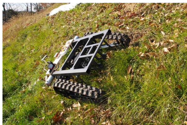
Fig. 2 Test of travel unit with crawler in steep slope

45度前後の斜度でテストした状況を Fig. 2 に示す。試験により、斜面の上下方向の走行、等高線方向の走行、その場旋回などが可能であることが確認できた。