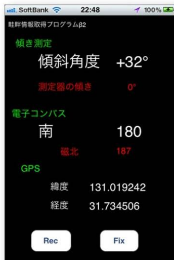
Fig. 9 Mobile phone application

畦畔法面の水平面への投影面積はGISから座標を取得し、法面の傾斜角度は角度計測が可能なセンサ(3軸ジャイロや加速度センサ)とGPSを有した携帯端末を利用して、除草ロボットの作業計画に必要な畦畔法面に関する属性情報(傾斜角度、傾斜方角、座標)を簡便に計測して、法面の面積を推定する手法を開発した。携帯端末専用に試作した計測プログラムは、加速度センサ(y,z軸)から傾斜角度と測定器の傾き(x軸)、傾斜の方角(16分割)、GPSによる座標(緯度、経度)をリアルタイムで計測、表示、記録することが可能である。計測画面例をFig. 9に示す。