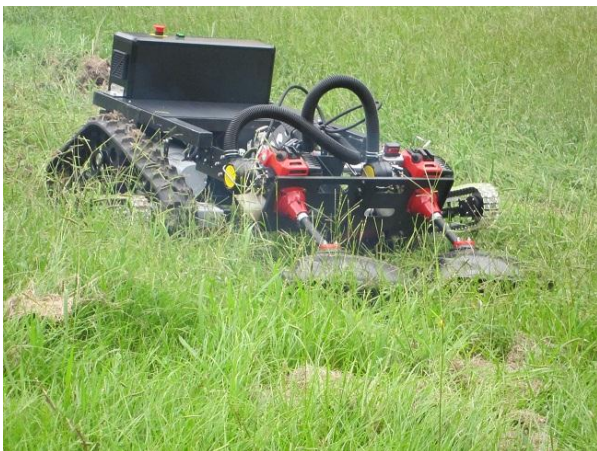
Fig. 5 Grass cutting robot in steep slope