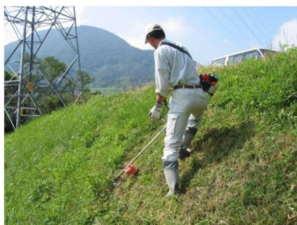
Fig. 1 Grass cutting with brush cutter in steep slope

また、乗用型草刈機もあり、乗車して楽で比較的安全に作業ができるが、限界作業傾斜度は20度程度のもが多い。中には、40度近くまで作業可能なものもあるが、凹凸の少ない河川の大型法面向きのもであり、多様な傾斜度や表面状態の中山間棚田に対応するには新たな観点での技術開発が必要である。