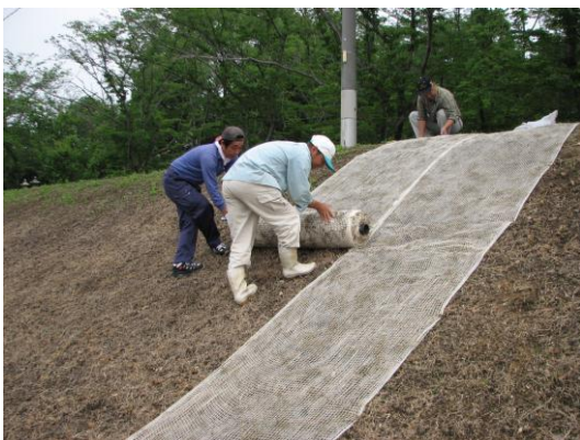
Fig. 6 Double net method

雑草で覆われた畦畔をシバ ( Zoysia japonica Steud.) に植生転換すると、ロボットでの除草管理が容易になる。シバは被覆力に優れて、メヒシバやセイタカアワダチソウなどの大型雑草の発生を抑制するとともに、大型法面や農作業体系に馴染み易く、畦畔管理の省力化が期待できる。シバを主体とした畦畔では草高が 15 cm 程度のため、除草ロボットの走行が容易である。Fig. 6 に二重ネット工法による植生転換試験の様子を示す。