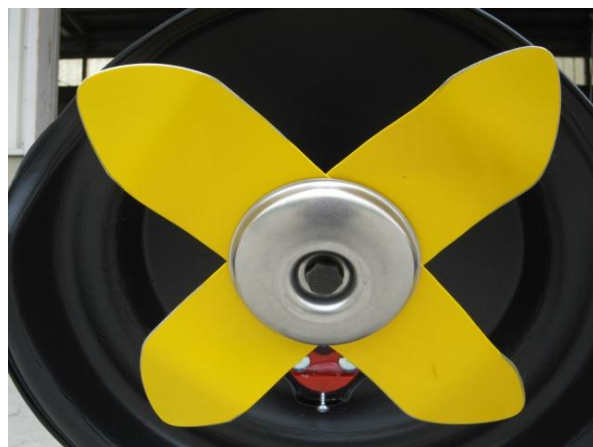
Fig. 3 Grass cutter

Fig. 3に、採用したロータリー式の刈刃部分を示す。この機種では、カバーの内側で刈刃が高速で回転することにより、刈り取った草を細断することができる。細断することにより、集草する必要がなくなるため、この機種を採用した。